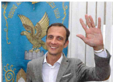
Massimiliano FEDRIGA, presidente della Regione

Questo CN ha una duplice valenza: ritrovarsi in presenza dopo il CN di Rimini del febbraio 2020 per dare a tutti i nostri genitori associati e non, un segnale di speranza e fiducia, e soprattutto far riassaporare il piacere di incontrarci.