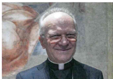
Mons. Vincenzo ZANI, Segretario della Congregazione per l'Educazione Cattolica della Santa Sede

La crisi pandemica ha messo a nudo le difficoltà di molte istituzioni scolastiche di fronte a situazioni di emergenza, carenze logistico-infrastrutturali e insufficienti risorse umane che non hanno consentito di