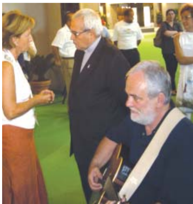
Meeting Rimini 2005 - In occasione della presentazione della mostra del trentennale AGeSC