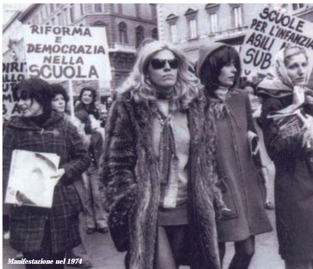
Manifestazione nel 1974

stesso anno della pubblicazione, da parte della Congregazione per l'Educazione Cattolica, del documento "La scuola cattolica oggi in Italia", che lo stesso mons. Dionigi Tettamanzi, già segretario della Conferenza Episcopale Italiana, definirà "il testo di riferimento più chiaro e completo sulla definizione, sui contenuti e sullo spirito di una scuola che intenda essere cattolica".