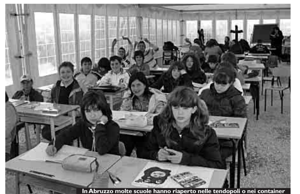
In Abruzzo molte scuole hanno riaperto nelle tendopoli o nei container