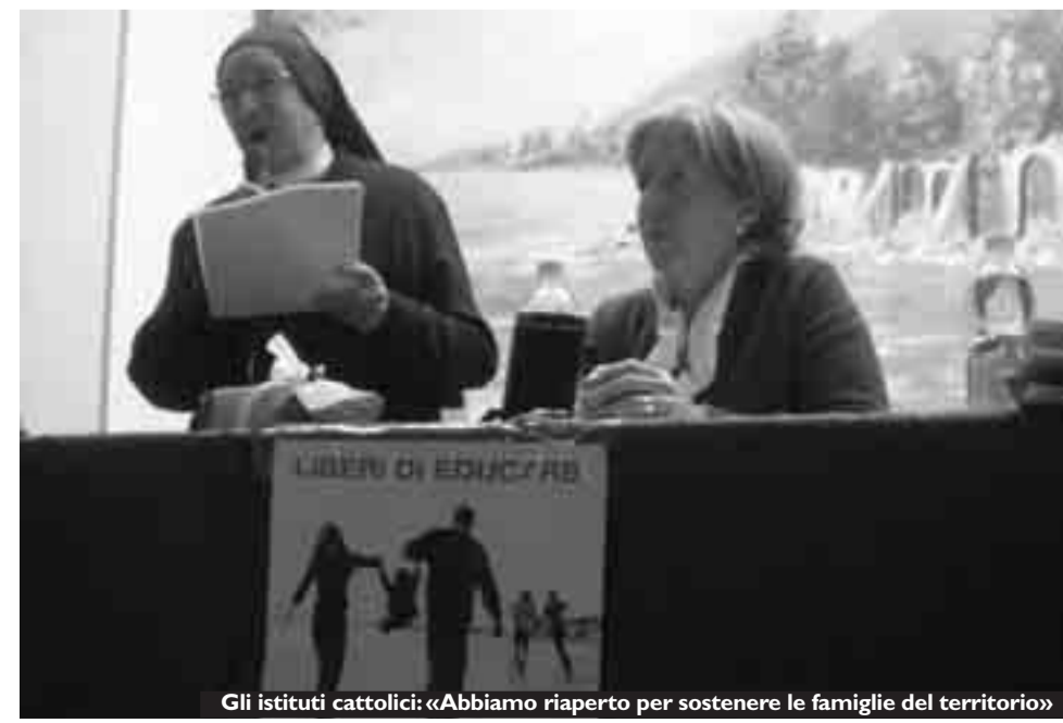
Gli istituti cattolici: «Abbiamo riaperto per sostenere le famiglie del territorio»