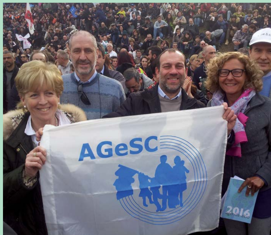
Anche l'AGeSC al Family Day

N ell'anno 2015 la nostra Associazione ha festeggiato i suoi primi 40 anni di vita. Come è nel nostro stile lo abbiamo fatto senza sfarzi inutili, senza sprechi, ma come si fa normalmente in famiglia con gioia, delicatezza e con il giusto calore umano.